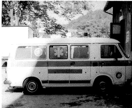
Ambulanze anni '70: costituzione delle tre Fondatrici P.A. Croce Italia, P.A. Città di Bologna, Coop. Croce Azzurra

Più che la narrativa della nostra storia, per rendere l'idea del percorso che le Fondatrici e la Fondazione hanno avuto in questi cinquant'anni di storia, pensiamo sia utile un raffronto tra i modelli di ambulanze utilizzate negli anni '70, negli anni '80 e quelle di recente dotazione.